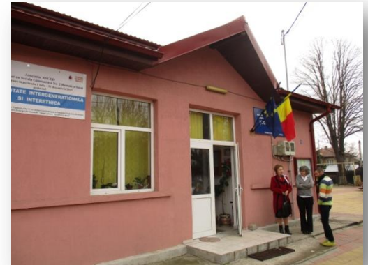
Scoala Gimnaziala NR.2

Realidades diferentes mas cheias de experiências e aventuras para partilhar.