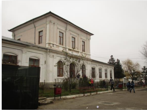
Scoala Gimnaziala NR.1

Durante a estadia em Ramnicu Sarat tivemos a oportunidade de visitar duas escolas da localidade.